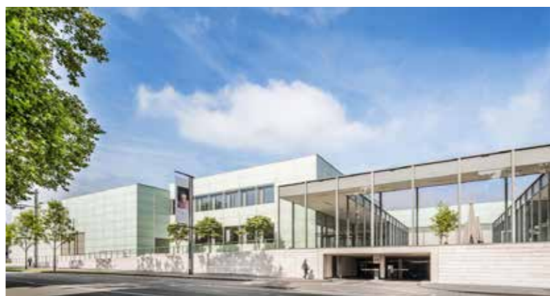
Der imposante Neubau des Museum Folkwang von David Chipperfield.

Nur ein paar hundert Meter entfernt geht's dann zum kulturellen Gegenpol. "Zum Xaver" ist eine der ältesten Imbissbuden in Deutschland. Seit 1952 gibt es hier mit die besten Hähnchen und Currywürste der Stadt. Dazu noch ein Pils und fertig ist das perfekte Ruhrgebiets-Mittagessen. Danach lassen Sie sich am besten über die nahegelegene "Rü", die Rüttscheider Straße treiben. Individuelle Boutiquen, Shops und Bars lassen Sie schnell die Zeit vergessen. Aber Vorsicht: Verträumen Sie nicht Ihr Date in der School of Drinking! Bei Gin,