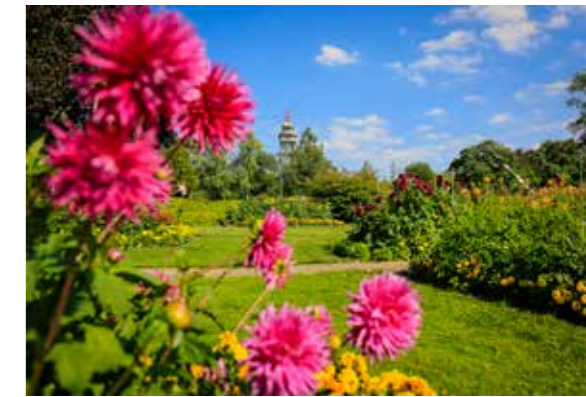
Im Grugapark gibt es Blumen soweit das Auge reicht.

Essen und die umliegenden Städte genießen können. Danach geht es für Sie in einen der größten innerstädtischen Parks Europas, den Grugapark. Mitten drin erwarten Sie über 500 Tiere. In direkter Umgebung des Parks können Sie den Tag in „Der Fischerei“ ausklingen lassen und dabei zumindest kulinarisch ganz tief in die Welt der Ozeane eintauchen. Sollten Sie die kleine Weltreise danach noch weiterführen wollen, erwarten Sie auf der "Rü" Bars, Cafés und Pubs zum Versacken.