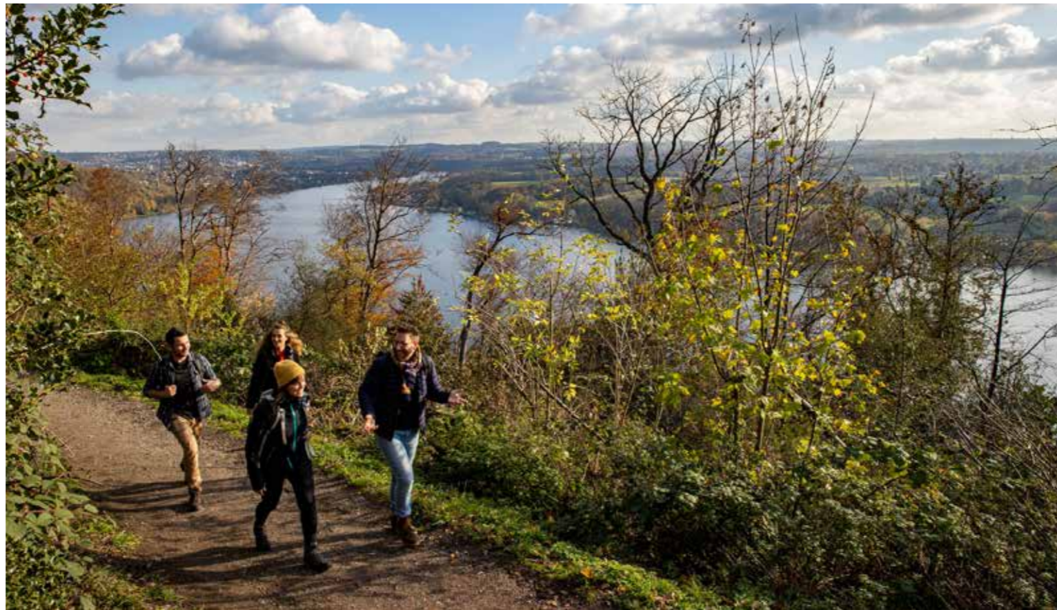
Ankommen und Durchatmen: Genießen Sie die Schönheit und Vielseitigkeit der grünsten Stadt Nordrhein-Westfalens. Zum Beispiel auf den Wandersteigen, am Baldeneysee oder – wie hier – an der Ruhr.

Essen ist ein Schmelztiegel der Kulturen. Wenn Sie den perfekten "Clash of Cultures" erleben möchten, sind Sie hier goldrichtig. Der Tag startet mit einem Besuch des Museum Folkwang. Mit vier Werken von van Gogh, Monet, Picasso oder Cézanne verfügt es über eine hochklassige Sammlung internationaler Kunst – und das Beste: der Eintritt in die Dauerausstellung ist frei!