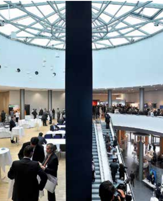
Essen zählt zu den Top-Ten-Messestandorten Deutschlands.

Abwechslungsreich, pulsierend und weltoffen – das ist Essen, eine der spannendsten Metropolen Deutschlands. Um 850 gegründet, von Äbtissinnen regiert und Jahrzehnte durch Kohle und Stahl geprägt, ist Essen heute die drittgrünste Stadt des Landes, moderner Wirtschaftsstandort und Heimat hochkarätiger Kulturinstitutionen.